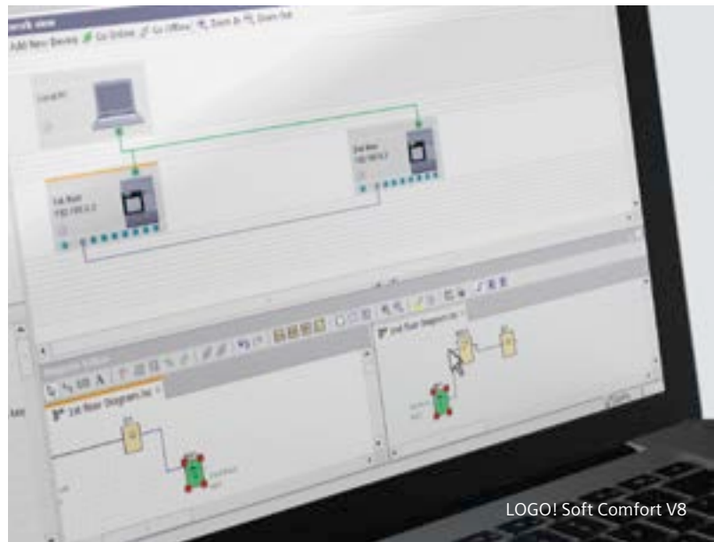
LOGO! Soft Comfort V8